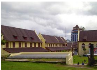
Aéroport de Makassar 📍 🚗 20km - ⌚ 40m Makassar 📍