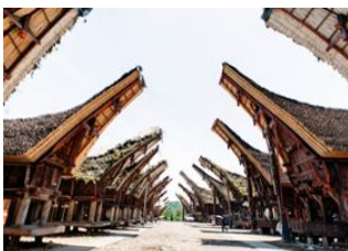
Makassar 📍 🚗 320km - ⌚ 8h Rantepao 📍