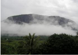
Tiong Ohang 📍