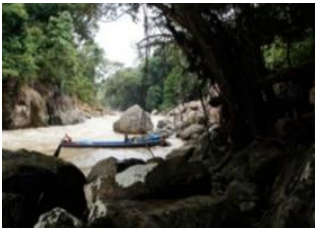
Tiong Ohang 📍 Rivière Bongan 📍