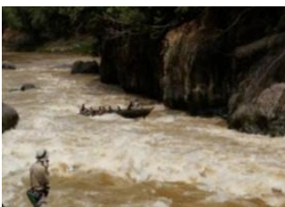
Rivière Bongan 📍 Tanjung Lokang 📍