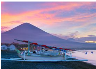
Aéroport de Denpasar 📍 🚗 105km - ⌚ 3h Amed 📍