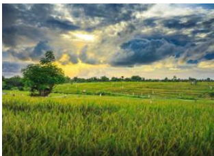
Aéroport de Denpasar 📍