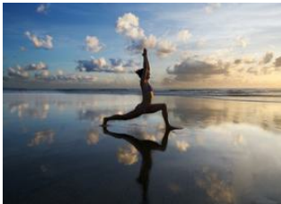
Munduk 📍 🚗 85km - ⌚ 3h Canggu 📍