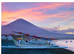
Aéroport de Denpasar 📍